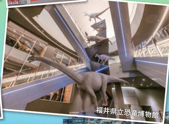
福井県立恐竜博物館