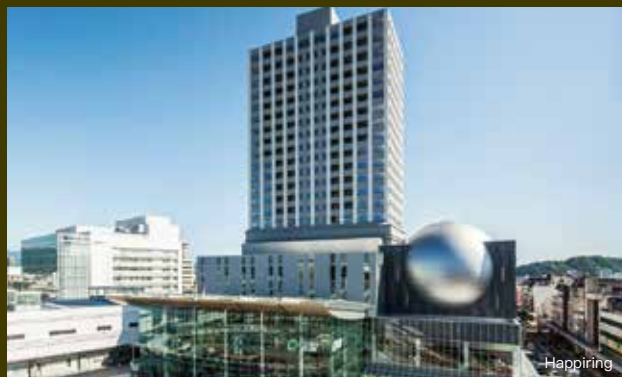
從福井車站只需徒步 1 分鐘即可抵達的功能型 MICE 設施，十分獨特