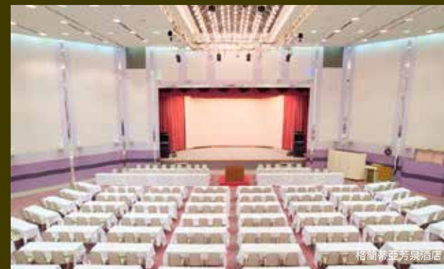
各個溫泉旅館皆有完善的 MICE 設備