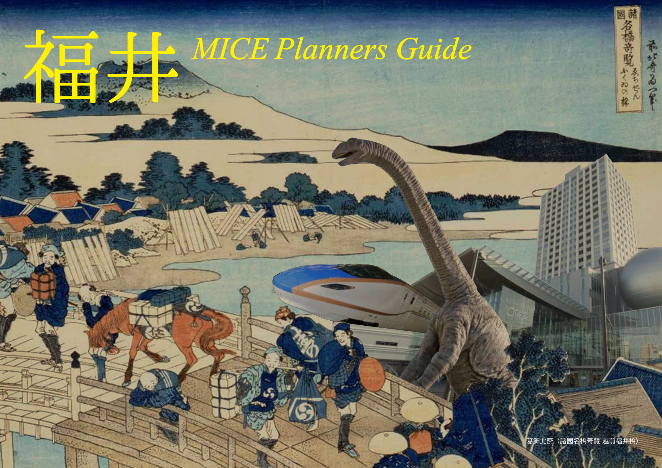
葛飾北齋 (諸國名橋奇覽 越前福井橋)