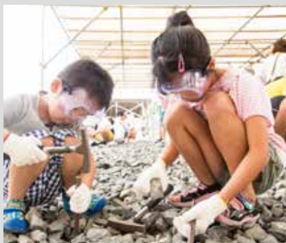
在勝山恐龍之森體驗化石挖掘