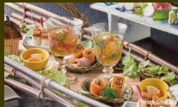
可享受許多來自日本海的當季新鮮料理