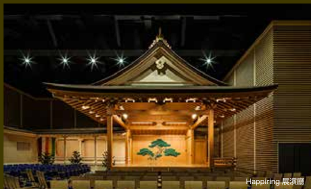
可善用能舞台，舉辦獨一無二的 MICE !