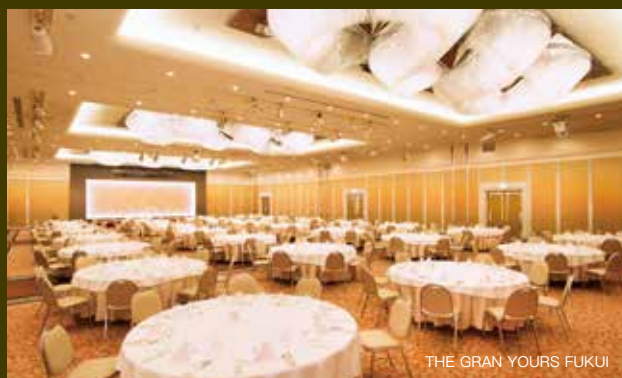
亦備有豪華的宴會會場