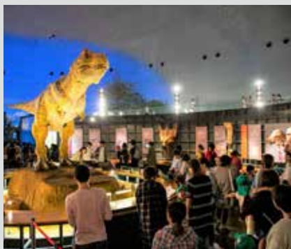
福井縣立恐龍博物館

福井不論是震撼力十足的恐龍王國，更擁有絕美景色及諸多美食，歡迎您親自前來體驗、探索！