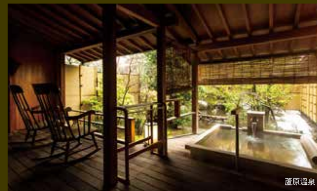
在蘆原溫泉營造開放式 MICE