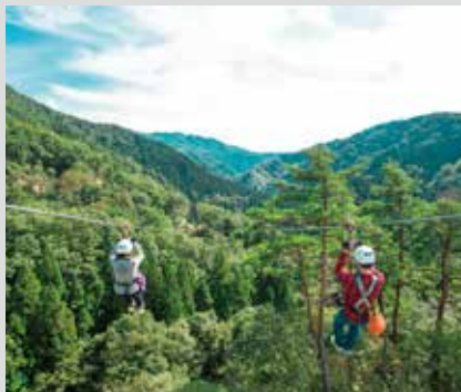
Tree Picnic Adventure IKEDA