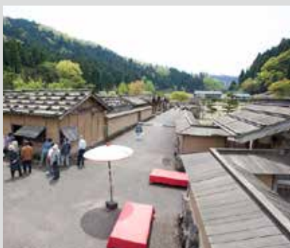
一乘谷朝倉氏遺跡