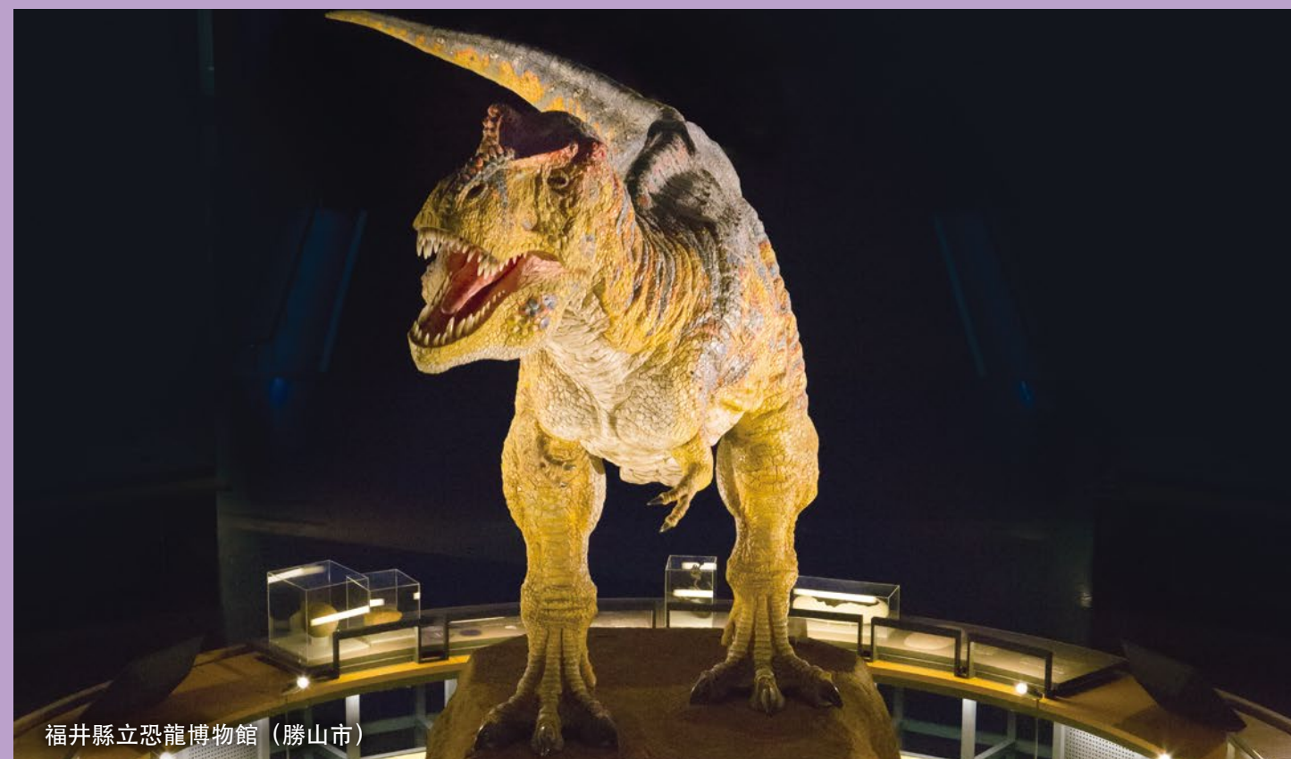
福井縣立恐龍博物館(勝山市)