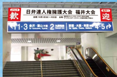
車站歡迎看板(圖片僅供參考)