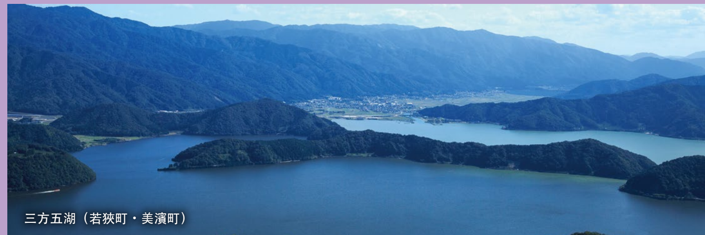
三方五湖(若狹町・美濱町)