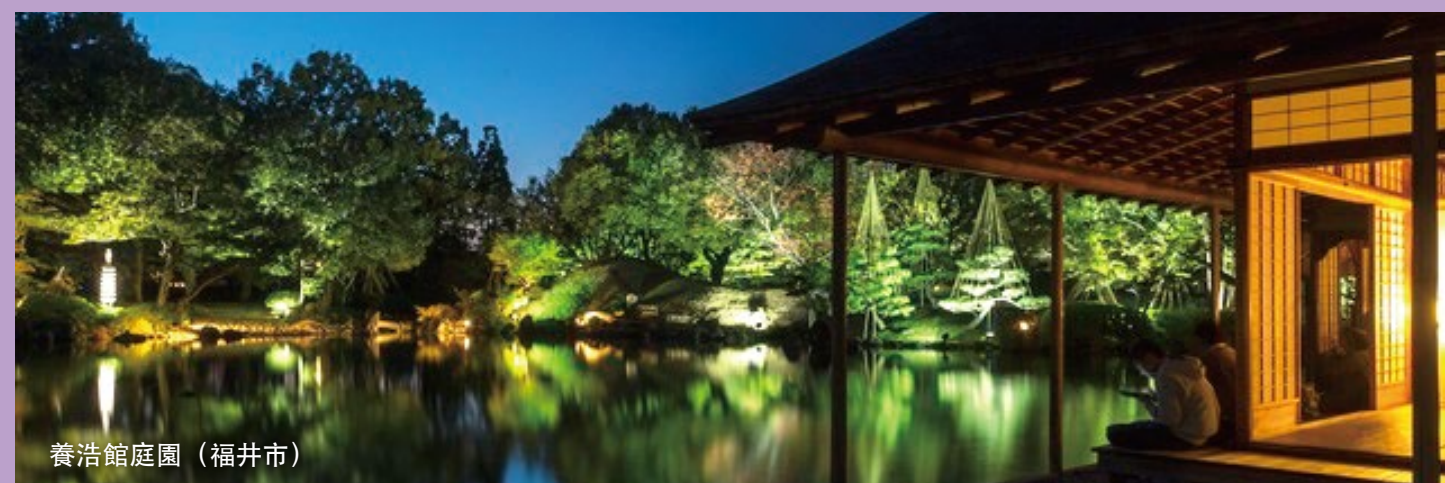
養浩館庭園(福井市)