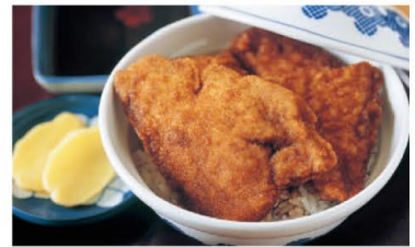
口いっぱい広がるソースと肉汁 ソースカツ丼

日本三大珍味の一つとされ、江戸時代の「日本山海名産図会」にも記されている福井の名産品。材料は、福井の越前海岸で獲れるバフンウニが中心。100gの製品を作るために100個以上ものウニが使われます。繊細で濃厚な味わいは、酒の肴や温かいご飯にピッタリです。