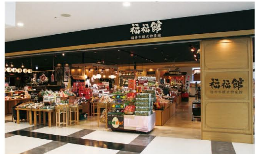
福井市観光物産館「福福館」(ハビリン2F)

福井の豊かな自然の中で育まれた農作物、お酒や加工品、また、巧みな技術で作られた伝統的な工芸品を展示・販売している。