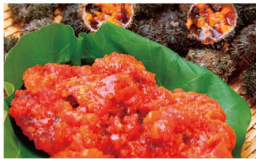
福井が誇る贅の極み 越前うに

らっきょう栽培の越冬は1回が一般的ですが、三里浜産らっきょうは全国で唯一2回越冬させた「三年子」。繊維が細かく身が締まり、小粒で歯切れ良く、「食わず嫌い」を返上する方も多い逸品です。秋、一面が紫色に染まるらっきょう畑の風景もおすすめです。