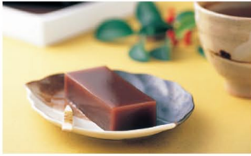
こたつで食べよう「冬の銘菓」水ようかん

全国的に夏菓子の「水ようかん」ですが、福井では冬が旬！シンプルで瑞々しい味わいは県民の「心のふるさと」。「冬はこたつで水ようかん」は福井の「標準語」です。冬に食べるようになった由来には諸説あり、興味があつたらお店の人に尋ねてみてくださいね。