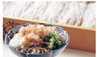
香り豊かなふるさとの味 越前おろしそば

肥沃な土壌、豊富で上質な地下水など、良好な生育環境に恵まれ、香り高い蕎麦が収穫できる福井。大根おろし・ネギ・鯉節でいただく「越前おろしそば」は、福井人がこよなく愛するふるさとの味。そば打ち体験ができる施設も多く、打ちたて、茹でたてを味わえます。