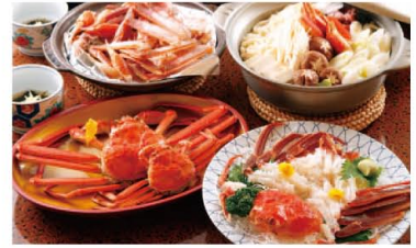
冬の味覚の絶対王者 越前がに

明治初期頃から、絹織物「羽二重」の一大産地となった福井。その高級感・きめ細かさを菓자에凝縮したのが「羽二重餅」です。上品な甘さとなめらかな口どけで、昔も今も変わらない定番の「福井土産」。日持ちするので、県外への手土産にも重宝されています。