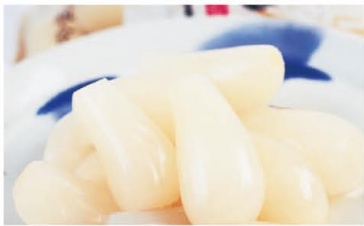
日本唯一の栽培方法 花らっきょう

福井の冬といえばコレ！毎年11月6日に漁が解禁されるズワイガニの雄は、黄色いタグがブランドの証。全国で唯一皇室に献上されているカニです！瑞々しく甘みが詰まった身と濃厚な味噌は、一度食べたら虜になる味わい。ぜひ海岸沿いのお店でご賞味ください。