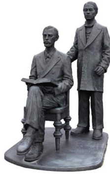
日下部太郎・グリフィス像