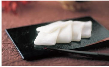
絹のような、とろける舌触り 羽二重餅

全国的に夏菓子の「水ようかん」ですが、福井では冬が旬！シンプルで瑞々しい味わいは県民の「心のふるさと」。「冬はこたつで水ようかん」は福井の「標準語」です。冬に食べるようになった由来には諸説あり、興味があつたらお店の人に尋ねてみてくださいね。