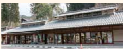
オリジナルジェラート 新鮮な魚介類も販売

道の駅グランプリ2000では、機能的で周りの景観と調和のとれた建築物として評価され、アメニティ部門総合デザイン賞を受賞しました。隣接しているそば処「よってっ亭」では、じねんじょそばが美味。