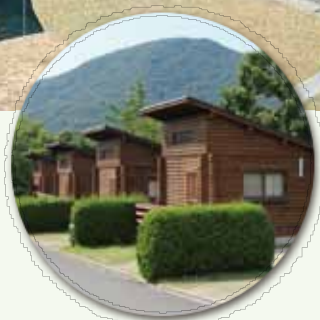
人気のケビンは14棟

美しい小浜湾を望む大島半島の海沿いにあり絶好のロケーションで楽しめる、JAC（一般社団法人日本オートキャンプ協会）認定の四ツ星キャンプ場です。充実した設備が整っていますので安心してアウトドアリゾートが楽しめます。