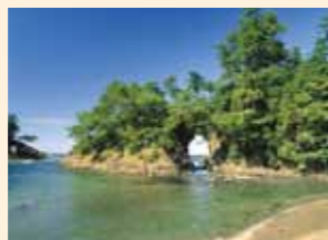
高浜町 (城山公園/明鏡湖)