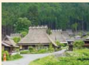
南丹市 (美山かやぶきの里)