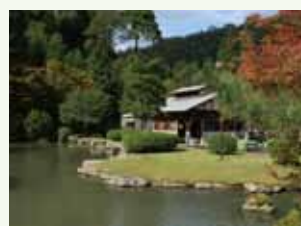
自然あふれる景観

キャンプにバーベキュー、テニスコートやサッカー場、ソフトボール場、コンベンションホールが充実しているのでスポーツ合宿にもご利用いただけます。茅葺きの家で素泊まりも出来ます。