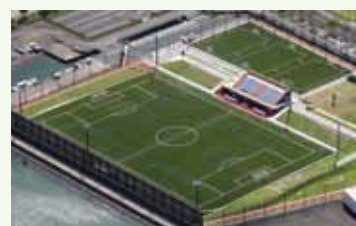
全面人工芝のメインコート