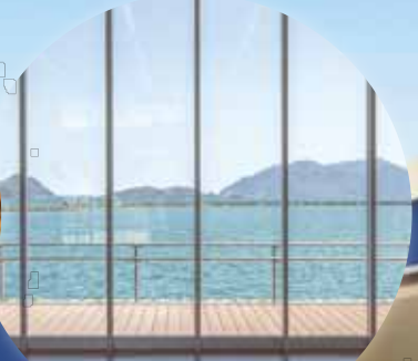
海を眺めてリフレッシュ