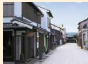
敦賀市 (博物館通り)