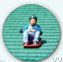
ソリ遊びならちびっこグレンド