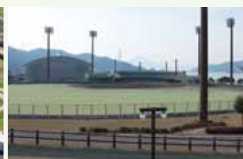
ナイターゲームも可能な野球場