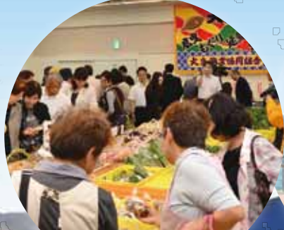
旬が集まる特産品売場