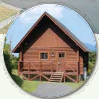
別荘気分のログハウス10棟