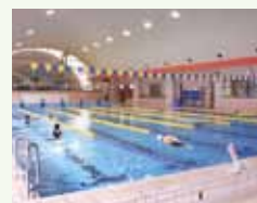
フィットネスプール