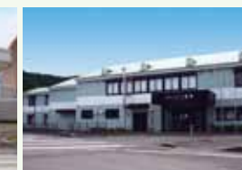
宿泊施設「スポーツロッジ栄光」