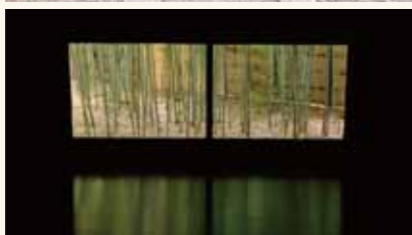
竹林が背景の幻想的な舞台