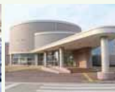
イベントワークステーション「悠久館」