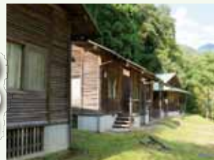
バンガローもあります