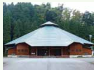
コンベンションホール