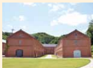
舞鶴市 (舞鶴赤れんがパーク)