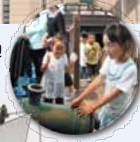
ボール大砲 海賊気分で大打ちまくれ!