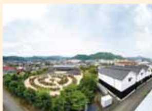
綾部市 (あやヘグンゼスクエア)