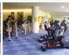
フィットネスジム