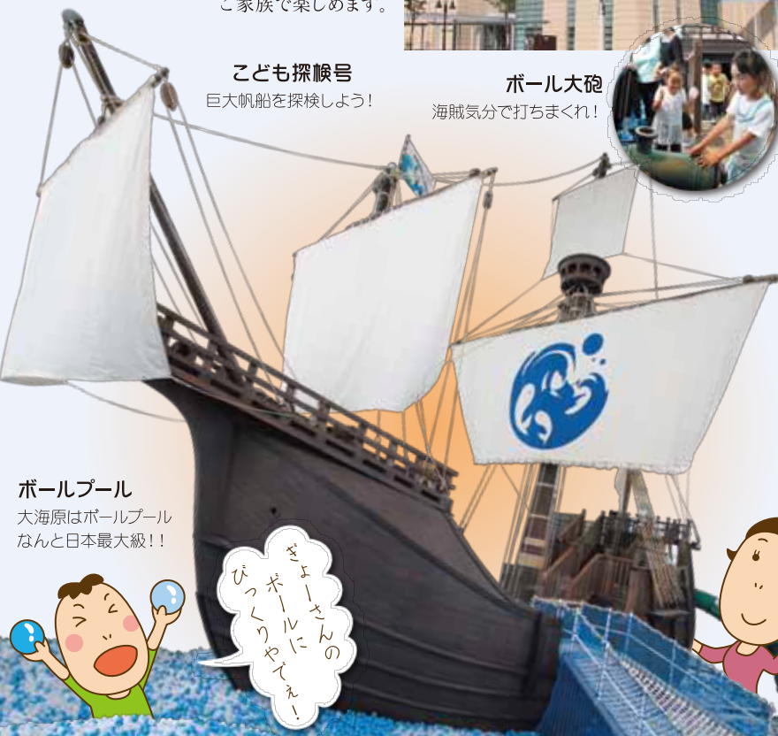
ボールプール 大海原はボールプールなんと日本最大級!!