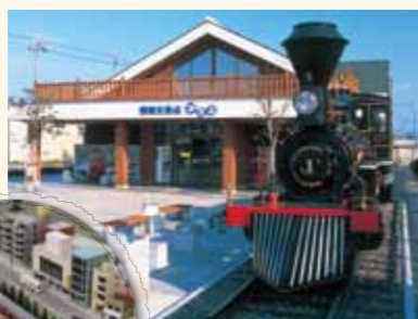
人気のジオラマ SL義経号

JR若狭本郷駅に隣接し、屋外には実物大のSL義経号が展示され、屋内には大飯地域をジオラマにした鉄道パノラマ模型を展示、走行しています。特産品や軽食コーナーも充実しています。