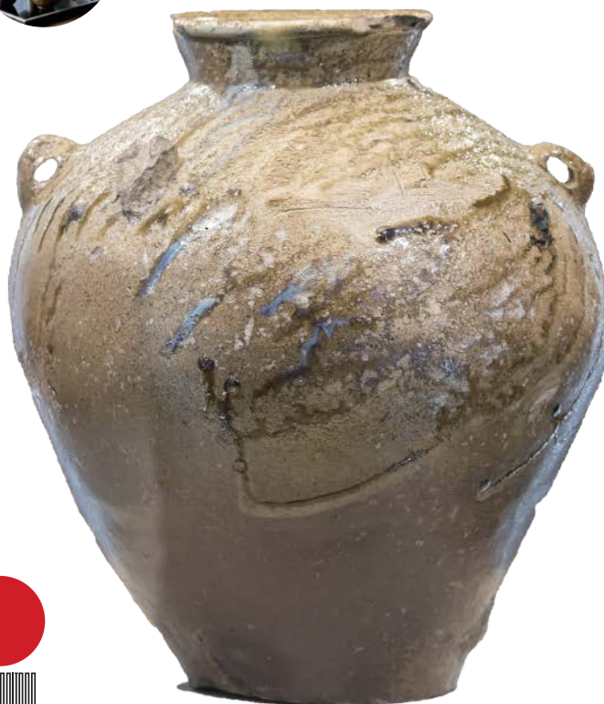
福井県陶芸館所蔵「双耳壺」